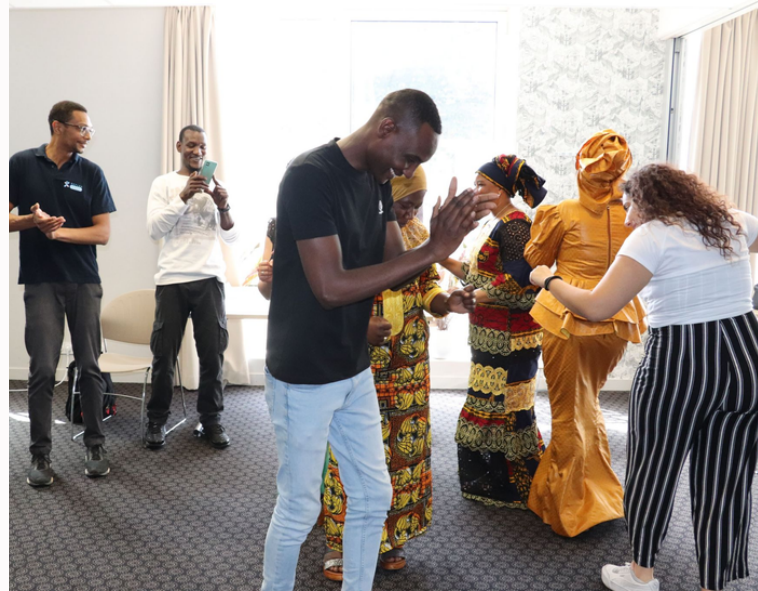
Journée cohésion d'équipe